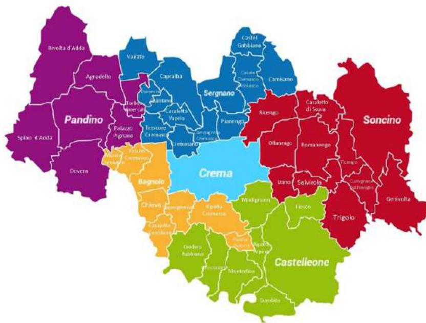
Rappresentazione grafica del Distretto Cremasco con i 48 Comuni

L'Azienda Socio Sanitaria Territoriale (ASST) di Crema è stata costituita a partire dal 1° gennaio 2016 con Deliberazione della Giunta Regionale n. X/4496/2015, in attuazione della LR n. 23/2015. L'ASST di Crema è un Ente con personalità giuridica pubblica avente autonomia organizzativa, amministrativa, patrimoniale contabile, gestionale e tecnica con sede legale in Crema (CR). La LR n.23/2015, istituendo l'ASST di Crema, ha stabilito che l'ASST comprende il territorio e le relative strutture sanitarie e sociosanitarie dell'ex Distretto ASL di Crema. Il bacino di utenza prevalente è l'area a nord della Provincia di Cremona, sostanzialmente corrispondente al Distretto Socio-Sanitario di Crema della ex ASL della Provincia di Cremona. Modificando il Titolo I e Titolo VII del Testo Unico delle leggi sanitarie in materia di sanità la LR n. 22/2021 ha dato ulteriore impulso all'assistenza sanitaria territoriale articolando il polo territoriale delle ASST in distretti e dipartimenti a cui afferiscono gli ospedali di comunità, le case di comunità e le centrali operative territoriali previste dal PNRR. Con delibera n. 210 del 29/03/2022 è stato formalmente istituito il Distretto Cremasco con le funzioni e i compiti assegnati dalla normativa.