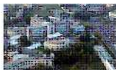
OSPEDALE MAGGIORE DI CREMA