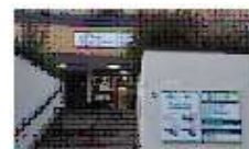
CASA DELLA COMUNITA