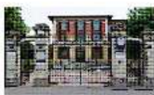
CENTRO DI CURE SUB ACUTE SONCINO