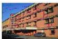
OSPEDALE SANTA MARTA DI RIVOLTA D'ADDA